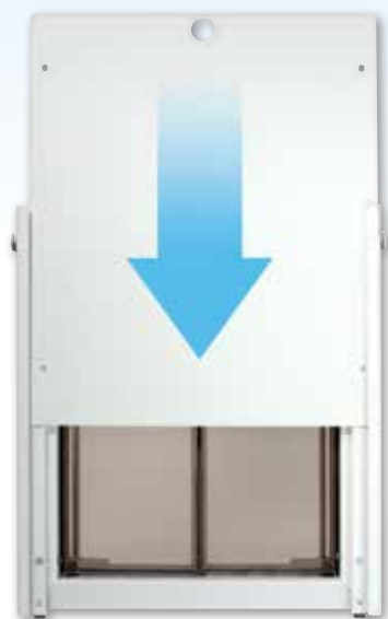
La plaque de sécurité glisse en place