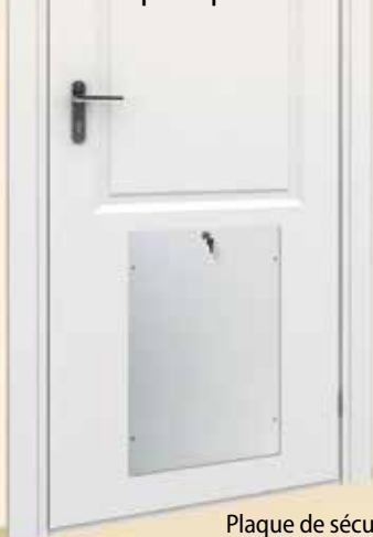
Plaque de sécurité en acier installée