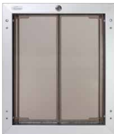
Vue intérieure (à l'intérieur de la maison)

L'unité PD WALL PlexiDor ne rouille pas, n'a aucun bord tranchant et est facile à nettoyer.