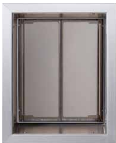
Vue extérieure (en dehors de la maison)

Chaque unité murale comprend un tunnel en aluminium qui relie le cadre intérieur et extérieur. Les matériaux dont il est fait assurent une finition et un ajustement professionnels qui rehaussent l'apparence de votre maison.